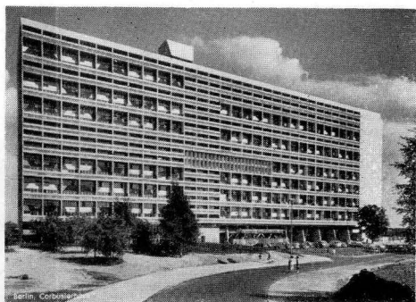
Le Corbusiers „Unité d'Habitation“ in Berlin. Was davon in der Erinnerung eines achtjährigen Mädchens bleibt, nämlich das Eigentliche dieses Hauses, ist auf dem Umschlag dargestellt